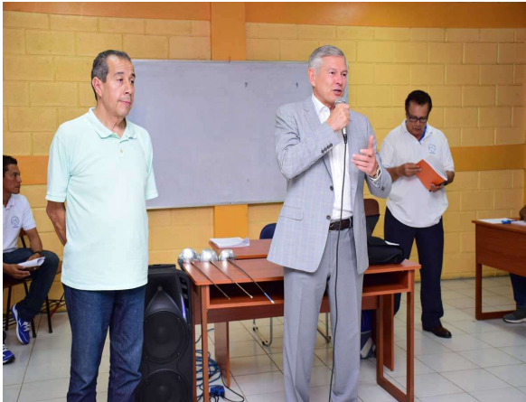
El Presidente de la Confederación Panamericana de Esgrima, Sr. Vitaly Logvin Inaugurando el Seminario