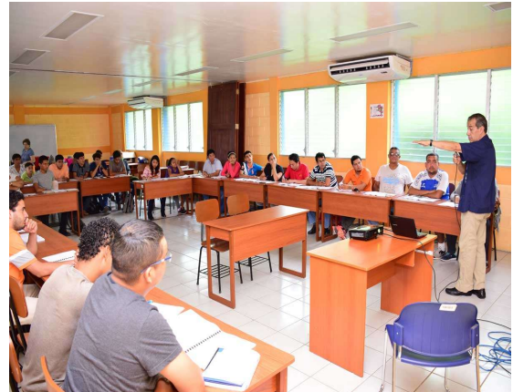
Veinticinco jueces y aspirantes de Nicaragua atendieron el Seminario