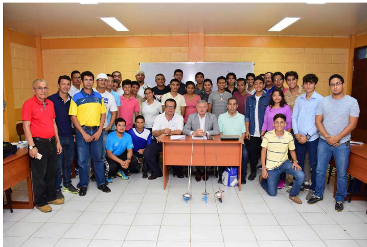
Los presidentes de la CPE y de la Federación de Esgrima Nicaragua con el Juez FIE e Instructor, y los asistentes al Seminario