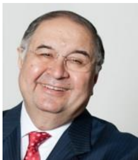
Alisher Usmanov Presidente de la FIE