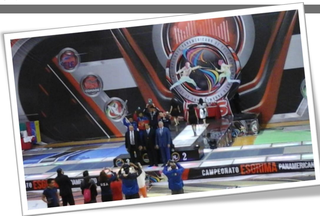
Aspecto de una ceremonia de premiación en éste Campeonato Panamericano de Esgrima, Cancún 2016

Damos voz a la petición de entrenadores de varias nacionalidades e idiomas, respecto a considerar que la gran belleza de Cancún, debe complementarse en hoteles y sedes, con la infraestructura adecuada para el uso de Servicios de Internet de calidad suficiente para el desarrollo de sus labores y comunicación, imprescindibles para con sus contrapartes en sus países de origen.